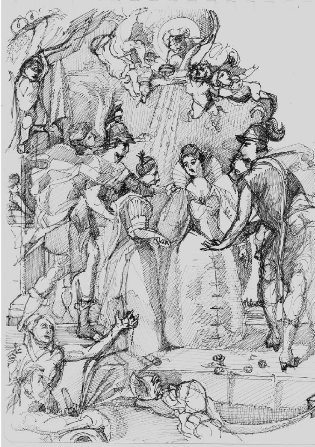
Titre : L'Échange des deux princesses de France et d'Espagne sur la Bidassoa à Hendaye, le 9 novembre 1615